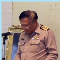
แผนกลยุทธ์ ๗ หน้า ๒