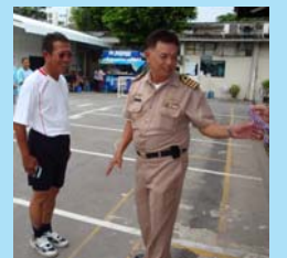
กิจกรรม ๗ หน้า ๔