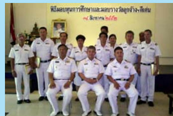
ลูกจ้างดีเด่น ๗ หน้า ๒