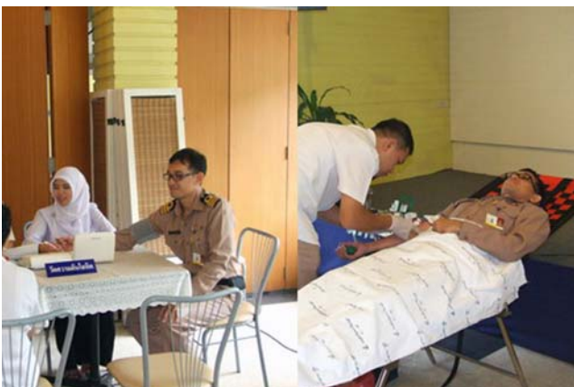
ข้าราชการและลูกจ้าง ร่วมบริจาคโลหิต