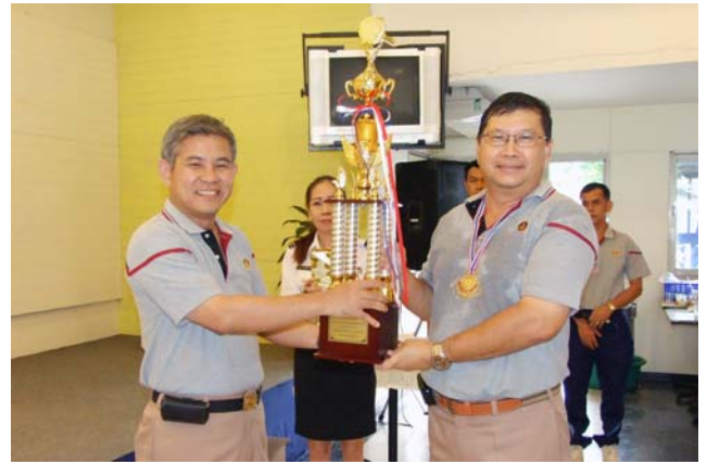
จก.ชย.ทร. มอบถ้วยรางวัลแก่ทีมที่ชนะเลิศการแข่งขันเทเบิลเทนนิส