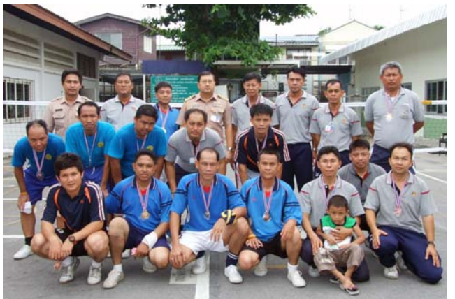
ทีมที่ชนะเลิศการแข่งขันเซปักตะกร้อ