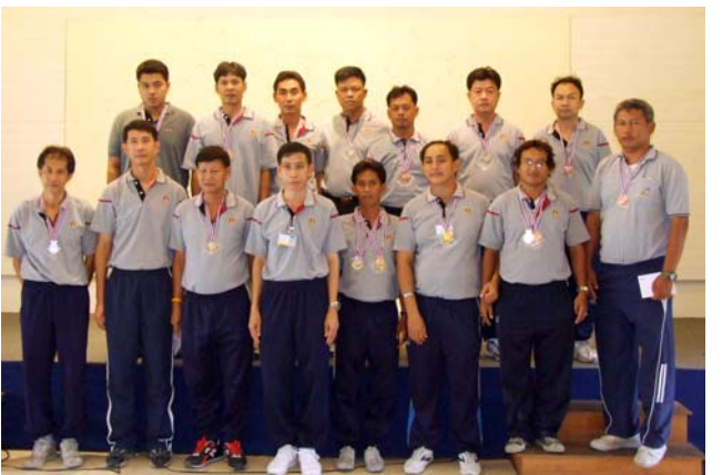
ทีมที่ชนะเลิศการแข่งขันหมากรุก