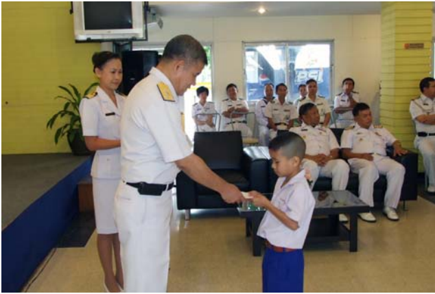
จก.ชย.ทร. มอบทุนการศึกษาแก่นบุตรข้าราชการ และลูกจ้าง ที่เรียนดี