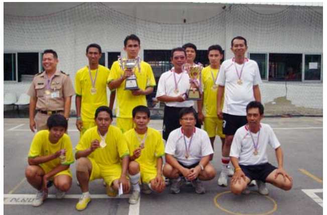
ทีมที่ชนะเลิศการแข่งขันฟุตบอล ๔ คน (ประเภทอายุเกิน ๔๐ ปี)