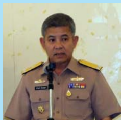
สัมมนาเชิงปฏิบัติการ ๗ หน้า ๒