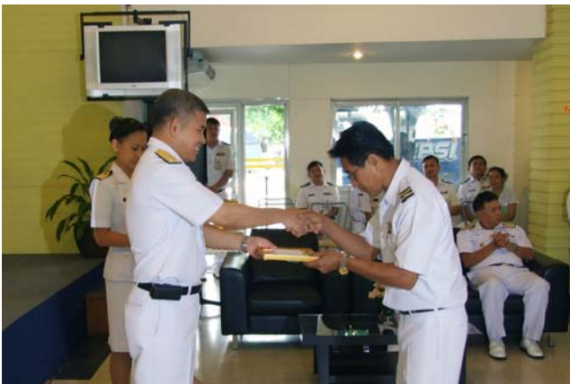
จก.ชย.ทร. มอบรางวัลลูกจ้างดีเด่น