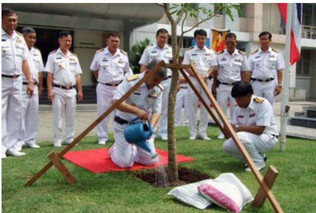
จก.ชย.ทร. ปลูกต้นปรีดียาธร เป็นที่ระลึก